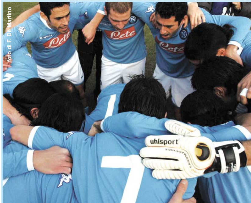
Il consueto rito dei calciatori azzurri prima delle gare